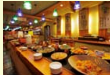
地産地消ビュッフェレストラン 一木一草

宮崎観光ホテルの本格的な 地産地消ビュッフェレストラン一木一草の 朝食が付いた宿泊プラン。 地元で採れた旬の食材を生かした お料理(約40種類)がお召し上がり いただけます。