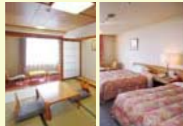
西館和室 西館ツインルーム